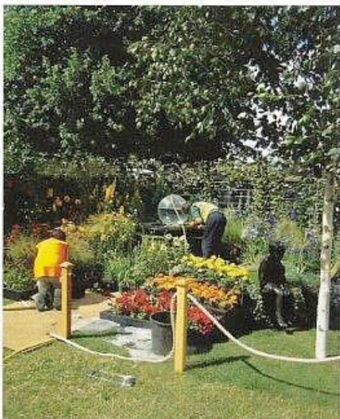
Vannfontenen skal fylles, blomster plantes og gjerde for publikum skal opp.