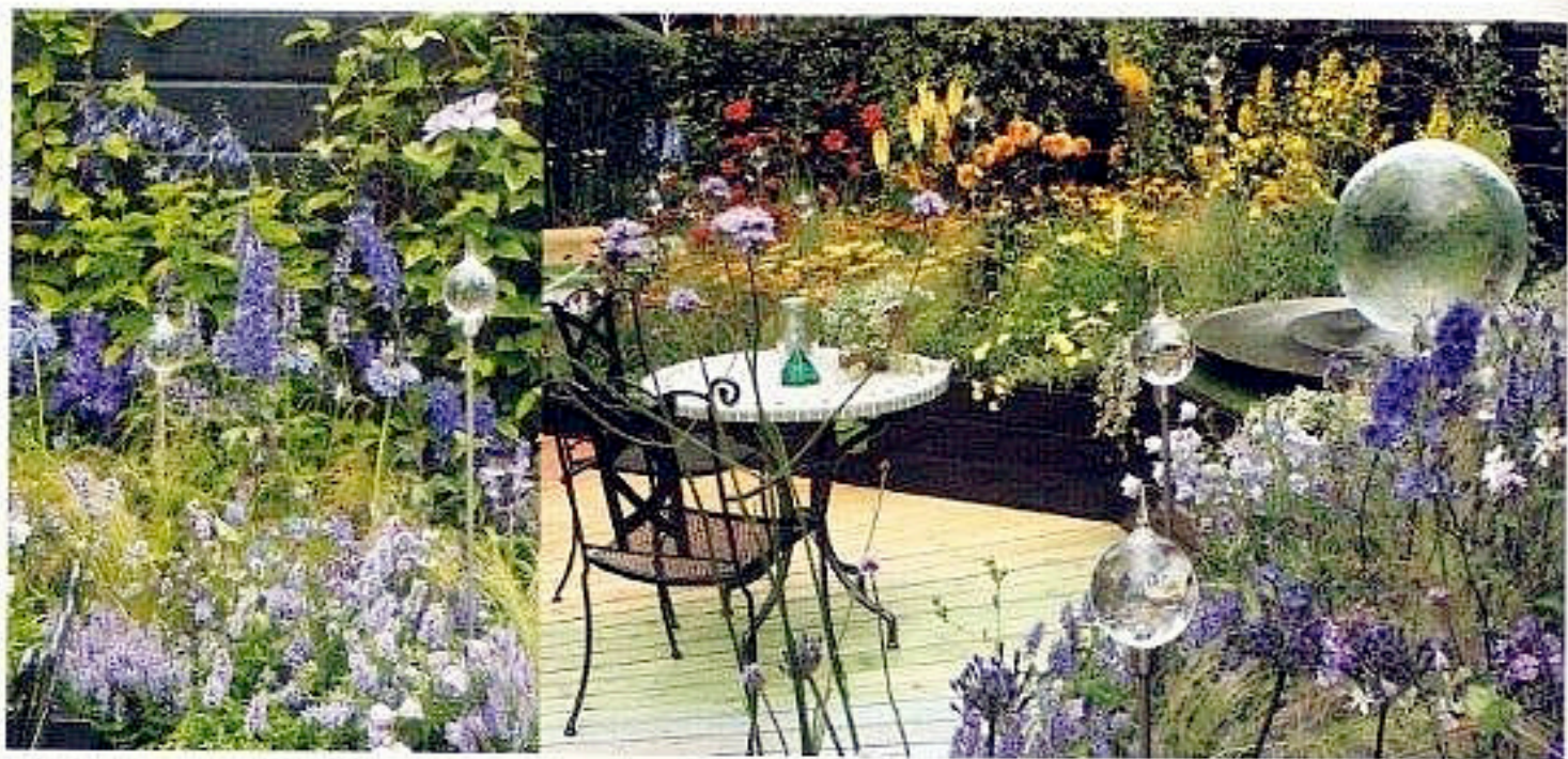
I den kjølige delen av hagen står blållille ridder- spore sammen med salvie og kattemynte.