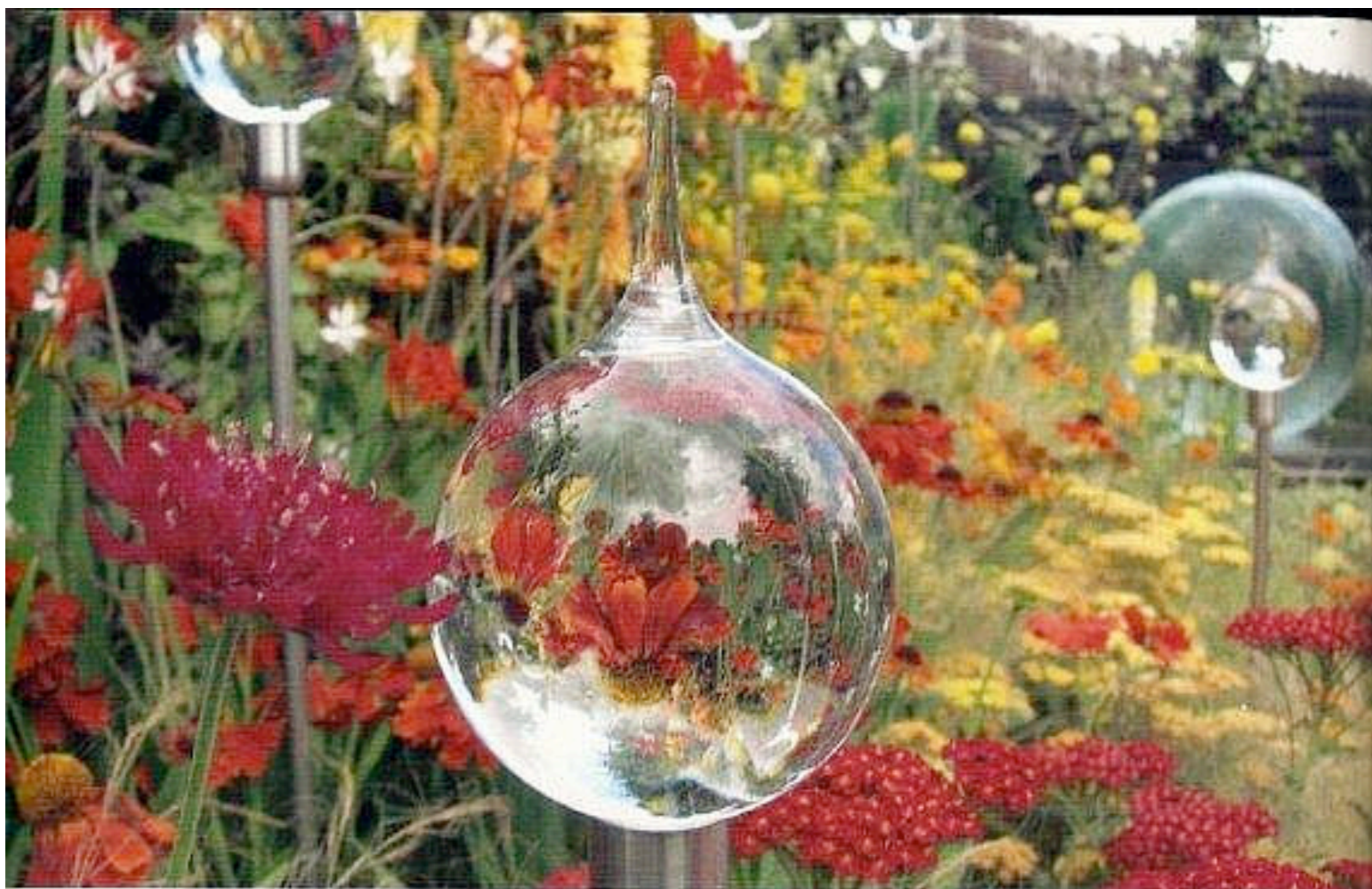
Hagen reflekteres i glassdråpene.

«Jeg ønsker å inspirere folk til å bruke mer farge i hagen»