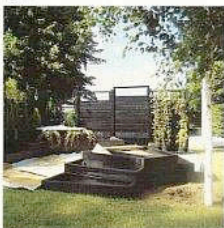
Klatrplantene løsnes og festet til faveggene. Dette arbeidet tok to personer to dager!