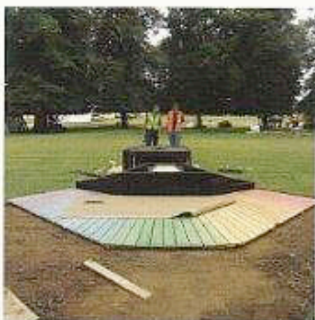
Andre dag, gangvei og første blomsterbed på plass.