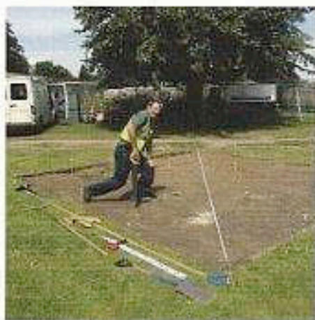
Første dag på Hampton Court. Jorden jernes og gjerdes kler til oppbygging.